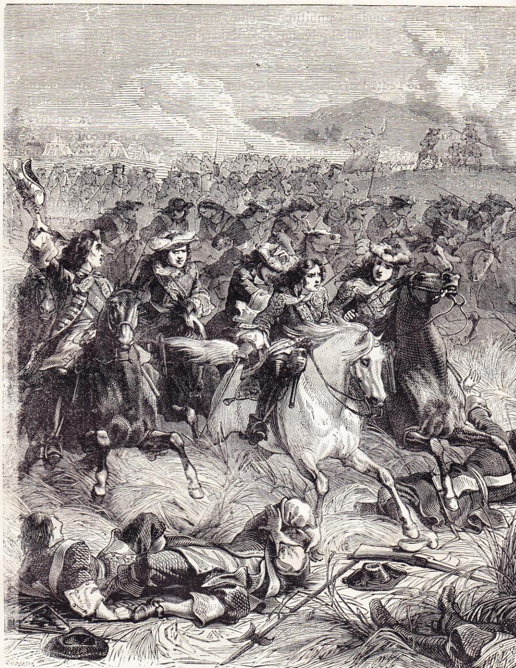
Bataille de Steinkerque (3 août 1692).

fense était faite aux autres de les suivre sous peine de confiscation de leurs biens. Malgré cette défense, 300 000 ré-