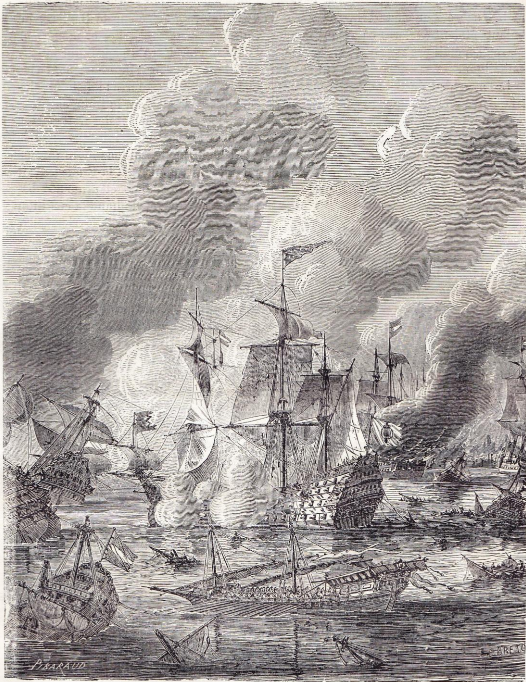
Victoire de Lagos, près du cap Saint-Vincent, par Tourville (1693).

Ceux qui restèrent n'attendirent que l'occasion de briser le joug qui pesait sur eux, fût-ce au prix d'une guerre civile.